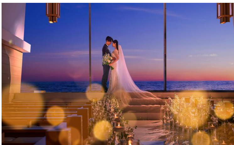
（上左：（福岡県）カビアーノ福岡・上右：（大阪府）The 33 Sense of Wedding・下：（千葉県）THE SURF OCEAN TERRACE）